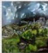
Vue de Tolède avec l'église de la Grâce