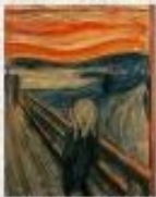
Le cri d'Edvard Munch

L'expressionnisme tend à déformer la réalité pour inspirer une réaction émotionnelle. Les représentations sont souvent fondées sur des visions angoissantes, déformant et stylisant la réalité afin d'atteindre une plus grande intensité expressive.